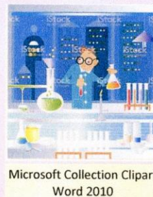
Microsoft Collection Clipart Word 2010