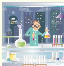
Microsoft Collection Clipart Word 2010

Concept : Créer un jeu d'évasion où chaque énigme résolue (un exercice de mathématiques) donne une pièce d'un puzzle.