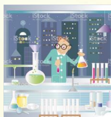
Microsoft Collection Clipart Word 2010

Le travail sera présenté sous forme d'un livret et d'un badge découpé en 7 pièces.